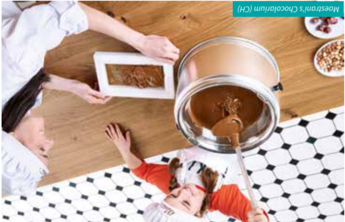
Maestrani's Chocoharium (CH)