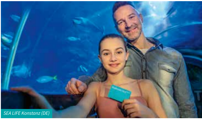
SEA LIFE Konstanz (DE)