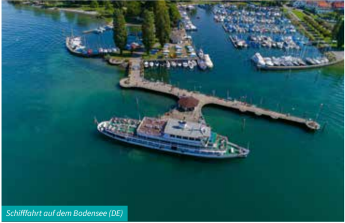
Schiffahrt auf dem Bodensee (DE)