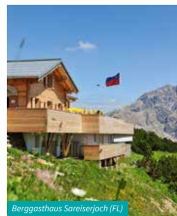
Berggasthaus Sareiseerjoch (FL)