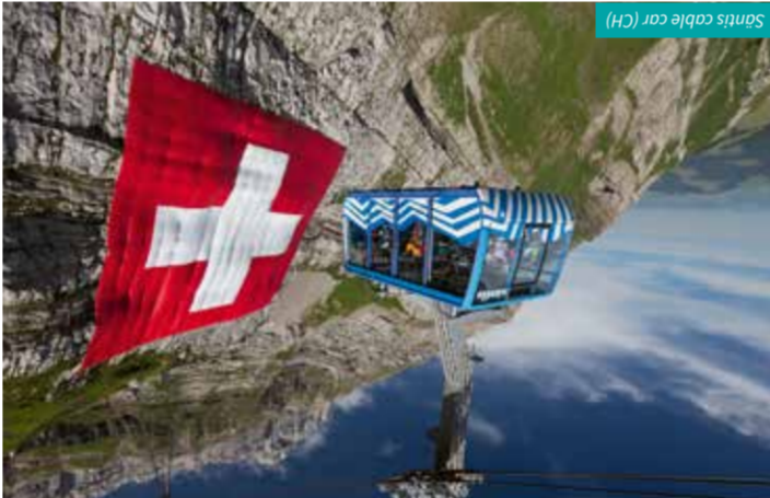
Santis cable car (CH)

Four countries, one lake and a few facts and figures Germany, Austria and Switzerland share the Lake Constance shoreline, while the small Principality of Liechtenstein lies somewhat upstream of the Rhine river. Of the total of 273 km of shoreline, 173 km belong to Germany, 72 km to Switzerland and 28 km to Austria. The total surface area of the lake is 536 km 2 . The area of the Principality of Liechtenstein, 160 km 2 , is less than a third of the lake's area.