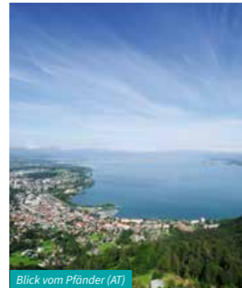
Blick vom Pfänder (AT)

The boat departs from Lindau to its neighbour Bregenz. Relax and enjoy the view of the Austrian and Swiss Alps. Just 10 minutes away from the harbour, the Pfänder cable car in Bregenz carries you up 1,064 m. Enjoy unique views of Lake Constance, Austria, Germany and Switzerland, and discover the local fauna on a short tour through the Alpine wildlife park. Following your trip to the lofty heights, bring the day to an unforgettable close: paddle your SUP board into the sunset and enjoy the last rays of the sun directly from the lake!