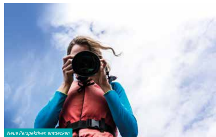
Neue Perspektiven entdecken

With the 4-seater Malbun-Sareis chairlift, you can reach an altitude of 2,000 metres in a matter of minutes. From here, enjoy a magnificent panorama of the Swiss and Austrian Alps and dine on regional culinary delights in the popular Sareis mountain restaurant. During a tour with the Citytrain you can immerse yourself in the princely history and experience the historical Old Vaduz, the Vaduz vineyards, the famous Red House and a wonderful panoramic view of Vaduz Castle. And last but not least: don't forget to pick up your own souvenir stamp to prove that you have been here! A great way to impress friends and family.