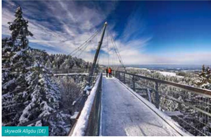
skywalk Allgäu (DE)