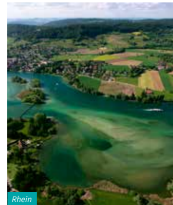
Blick vom Pfänder (AT)

¹ Preis- und Kursänderungen vorbehalten ¹ nur Montags möglich ² Price and currency changes reserved ² only possible on Mondays