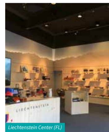
Liechtenstein Center (FL)