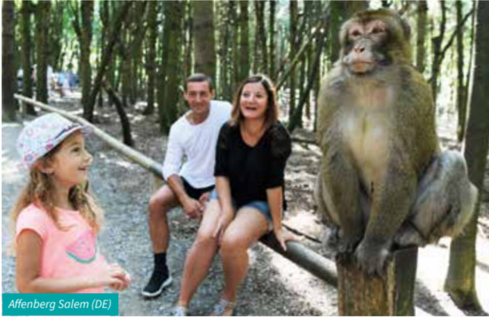
Affenberg Salem (DE)